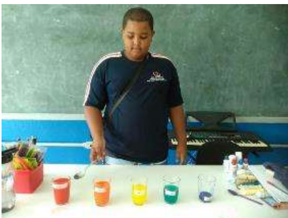
Cultura e Musicalidade