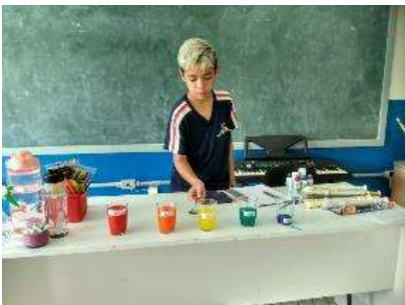
Cultura e Musicalidade