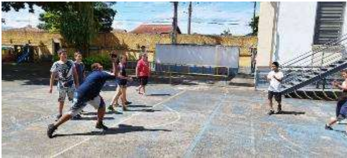
Esportes e Futebol