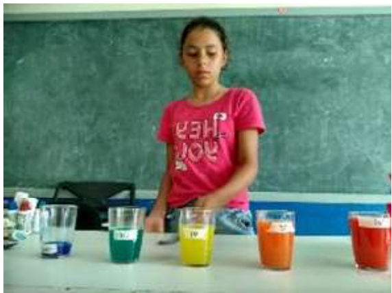
Cultura e Musicalidade

OBJETIVO ESPECÍFICO: Articular junto a rede socioassistencial, dos demais órgãos e das demais políticas públicas.