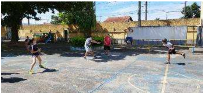
Esportes e Futebol