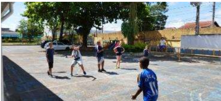
Esportes e Futebol