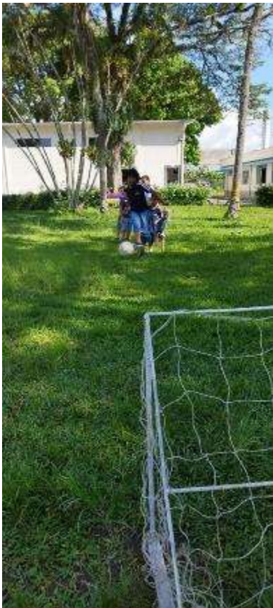
Esportes e Futebol