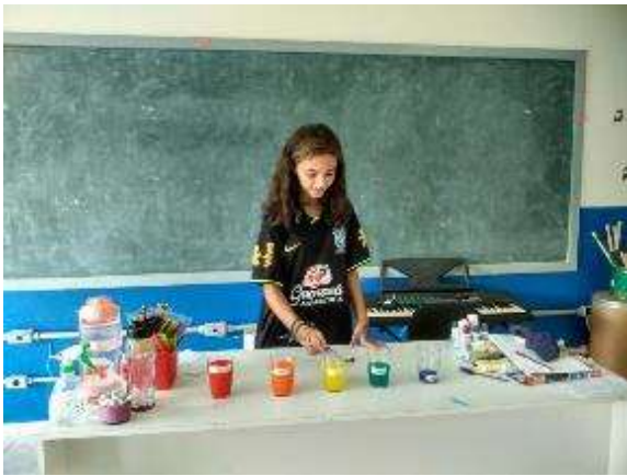
Cultura e Musicalidade